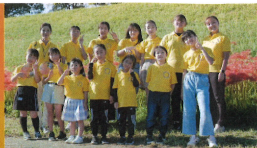
ココペリーナ ヒーリングボイスユニット。