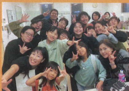
福岡ろう劇団博多 きこえない人ときこえる人で 構成される劇団。