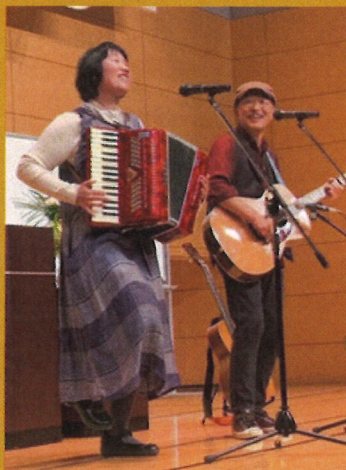
森和田 -moriwada- アイリッシュ系音楽ユニット。